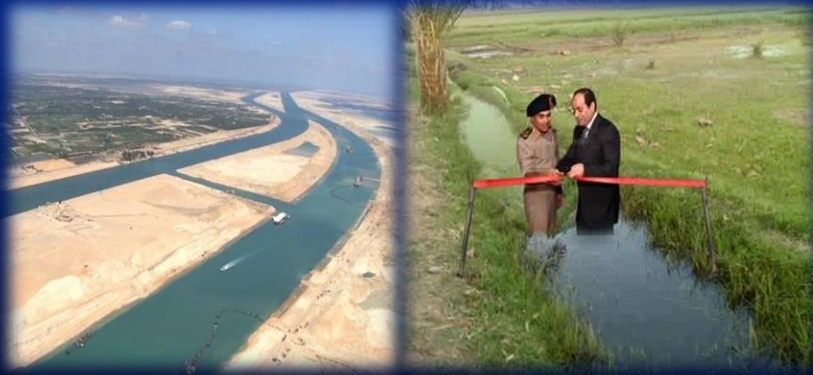
( قناة السويس الجديدة ترعة )

هي التي يتم ترويجها وإنتشارها ببطيء كالشائعات العدائية التي تستهدف القرارات السياسية والعسكرية بهدف (التحقيق منها - فقد الثقة - عرقلة خطوات التقدم الإقتصادي والسياسة - التشكيك في قدرات وإمكانيات القوات المسلحة) .