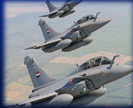
( طائرات الرافال طراز قديم وبها عيوب )