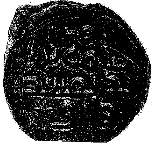
لوحة رقم (١)