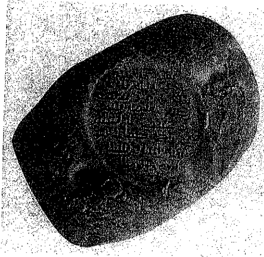
لوحة رقم (٢)

السؤال الأول : تعرف على اللوحات التالية واطرحها شرحاً وافياً : ( الزمن : ٤٥ دقيقة ) ( ١٥ درجة )