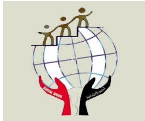
كلية الخدمة الاجتماعية