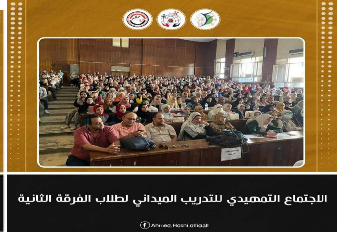
الاجتماع التمهيدي للتدريب الميداني لطلاب الفرقة الثانية