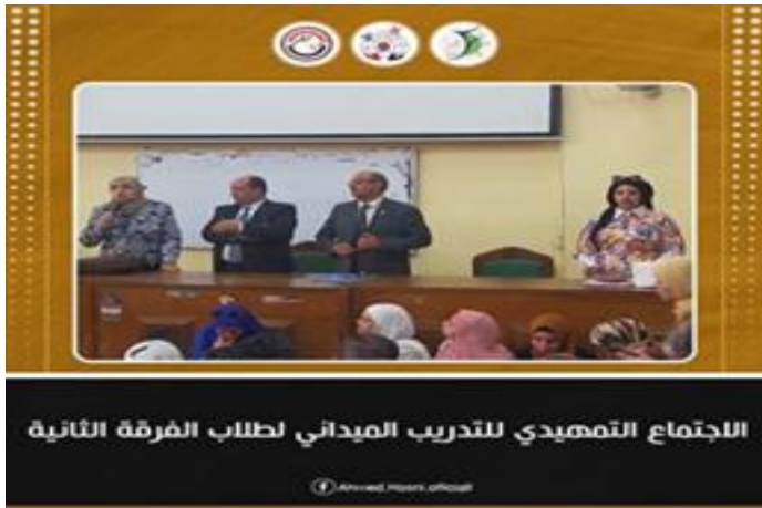
الاجتماع التمهيدي للتدريب الميداني لطلاب الفرقة الثانية

تم عقد اجتماع تمهيدي مع طلاب الفرقة الثانية انتظام وانتساب تناول الاجتماع عرض خطة التدريب الميداني للعام الجامعي ٢٠٢٢/٢٠٢٣ والتي تقوم على بناء الجدارات المعرفية والمهارية وتناول أيضا شرح كيفية التسجيل المهني في سجل المهارات وفق نماذج محددة بالسجل وقواعد الانتظام والالتزام بالتدريب الميداني