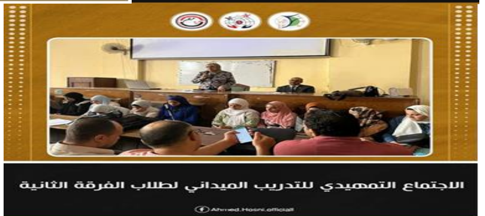
الاجتماع التمهيدي للتدريب الميداني لطلاب الفرقة الثانية